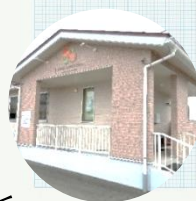
けんたろうこどもクリニック

矢巾町のホームページ うさちゃんのへや さくらんぼ広場 どんぐりっこ aiaiひろば