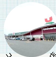
ユニバース矢巾店